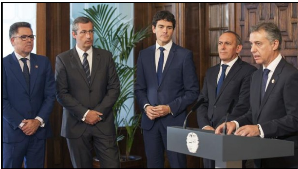
Acto de lectura de la Declaración institucional en defensa del Concierto Económico

Reafirmamos el compromiso de proteger con absoluta firmeza el Autogobierno vasco en general, y el sistema de Concierto Económico en particular 649 .